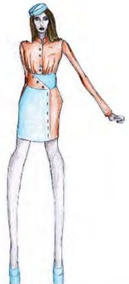
Сања Максимовић 3/2