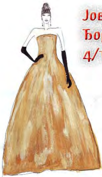
Јована Ђорић 4/1