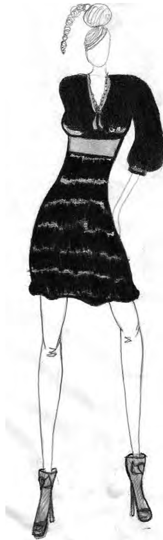
Кристина Филиповић 4-1